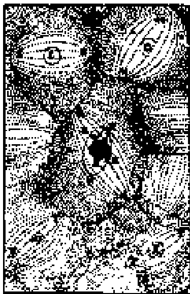
Abb. 3. Das Universum, wie es Descartes in seinen «Principia» dargestellt hat. Jede der Sphären Z, M, T, Y und AB stellt einen Wirbel (vortex) dar, mit einer Sonne als Zentrum (L, C, K, O, S). Descartes hat die Frage der die Sonne umkreisenden Satelliten niemals behandelt, sondern offen gelassen.

Die mechanische Schlichtheit eines solchen Systems war für viele unwiderstehlich. Trotz der aufgeworfenen Probleme 35 vermochte die cartesianische Kosmologie nahezu hundert Jahre lang ihren Platz zu behaupten, ehe sie schließlich an Einfluß verlor. 36 Mit der Ausbreitung und weitgehenden Annahme der Kosmologie des Descartes schlich sich der Gedanke der Einheitlichkeit des Universums in viele bislang davon unberührte Denker ein. 37 Denn wenn das Universum voll solcher Wirbel war, von denen ein jeder eine zentrale